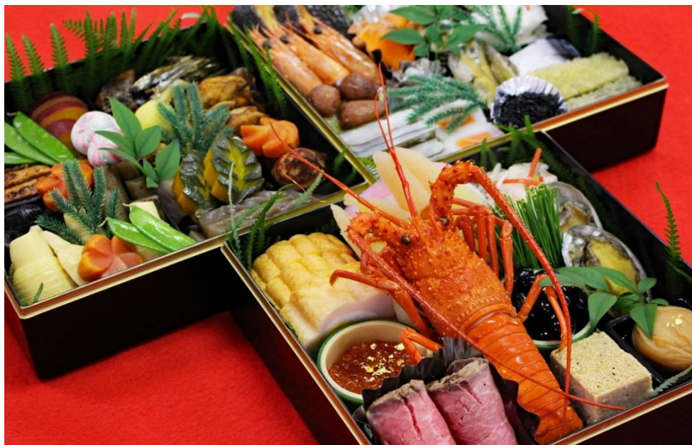
※写真はイメージです。内容が異なる場合がございます。

今年はやまア、鱈酒盗をはじめ 5種 のお料理を追加しました。 大切なお正月に、一段と豪華になった とれとれのおせちはいかがですか！